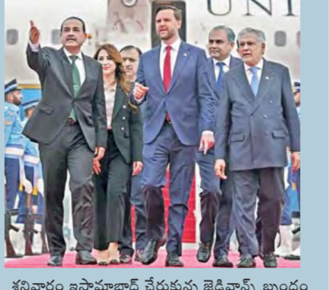
శనివారం ఇస్లామాబాద్ చేరుకున్న జెడిఎన్ఎస్ బృందం ఇస్లామాబాద్, ఏప్రిల్ 11: ఇరాన్ పై యుద్ధం ముగింపు కోసం అమెరికా, ఇరాన్ దేశాలమధ్య జరుగుతున్న శాంతి చర్చల్లో పురోగతి కనిపించకపోయినా ఒకరి డిమాండ్ల చార్జర్ మరోకరు పంపకున్నారు. >>2

ఇస్లామాబాద్ లో 'అమెరికా, ఇరాన్ మధ్య తొలిరోజు నాలుగు గంటలు చర్చలు పాక్ ప్రధాని షేహబాజ్ షరీఫ్ మధ్యవర్తిత్వం స్తంభించిన ఆస్తులు, నిధులు విడుదల చేయాలని ఇరాన్ డిమాండ్ కొత్త షరతులతో ముందుకు సాగని చర్చలు హార్డుకోపై కొనసాగుతున్న ప్రతిష్టంభన