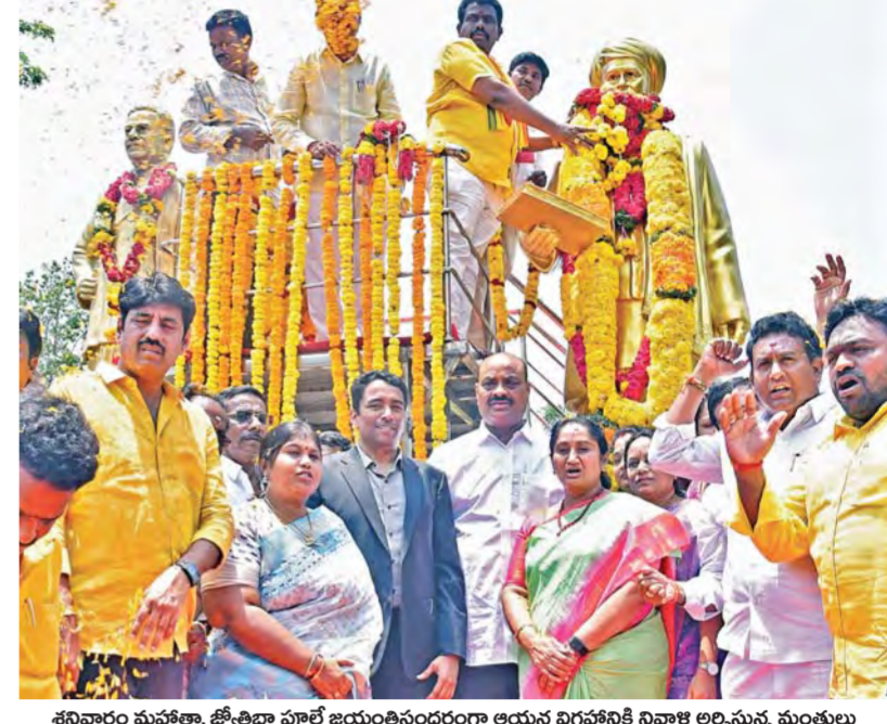
శనివారం మహారాష్ట్ర ట్యూరిజం పూల్ జయంతినంద్యంగా ఆయన విగ్రహానికి నివాళి అర్పిస్తున్న మంత్రులు